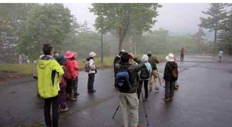
注目の的のジョウビタキ♂