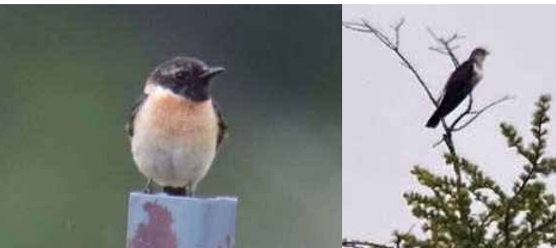
すまし顔のノビタキ♂

ノビタキがたくさん飛び回り、カッコウの囀りが響きます。のんびりチームとイケイケチームに別れそれぞれのペースでコースを回りました。カッコウを初めて見る人も数名いました。