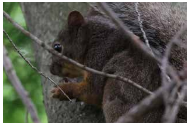
クルミをほおぼるニホンリス

2日目は早朝よりホテルの周辺を散策し、ヒガラにコムクドリ、キビタキ、アオバト等・・・声