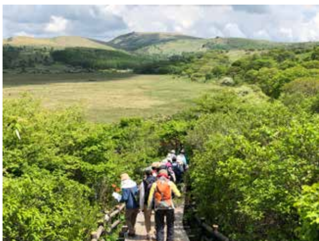
霧ヶ峰八島湿原の木道

「これは何かなあ？」と呟くと答えを返して下さる植物博士。昆虫博士もみえて今迄私には見えていなかった物、聞こえていなかった事を皆様からたくさん教えて頂きとても楽しい充実した時間を過ごせました。どうもありがとうございました。これからも学ばせて頂きたいのでどうぞよろしくお願い致します。