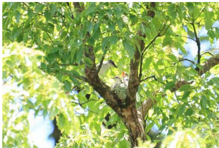
サンショウクイの雛への給餌